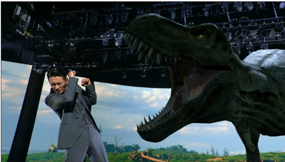
<그림 4> KBS 대기획 다큐멘터리 <키스 더 유니버스>