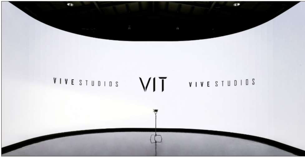
<그림 1> ㈜비브스튜디오스의 곤지암 스튜디오 LED월 전경

길 수밖에 없었지만 VP를 활용하면서 모든 시공간의 제약이 사라져 촬영의 효율이 크게 높아졌다[2].