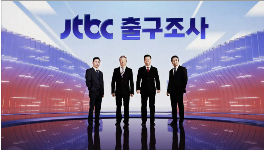
<그림 5> JTBC 대선개표방송 <2022 우리의 선택-비전 어게인>