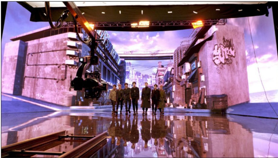
<그림 6> BTS Official Story Film - <7FATES: CHAKHO>