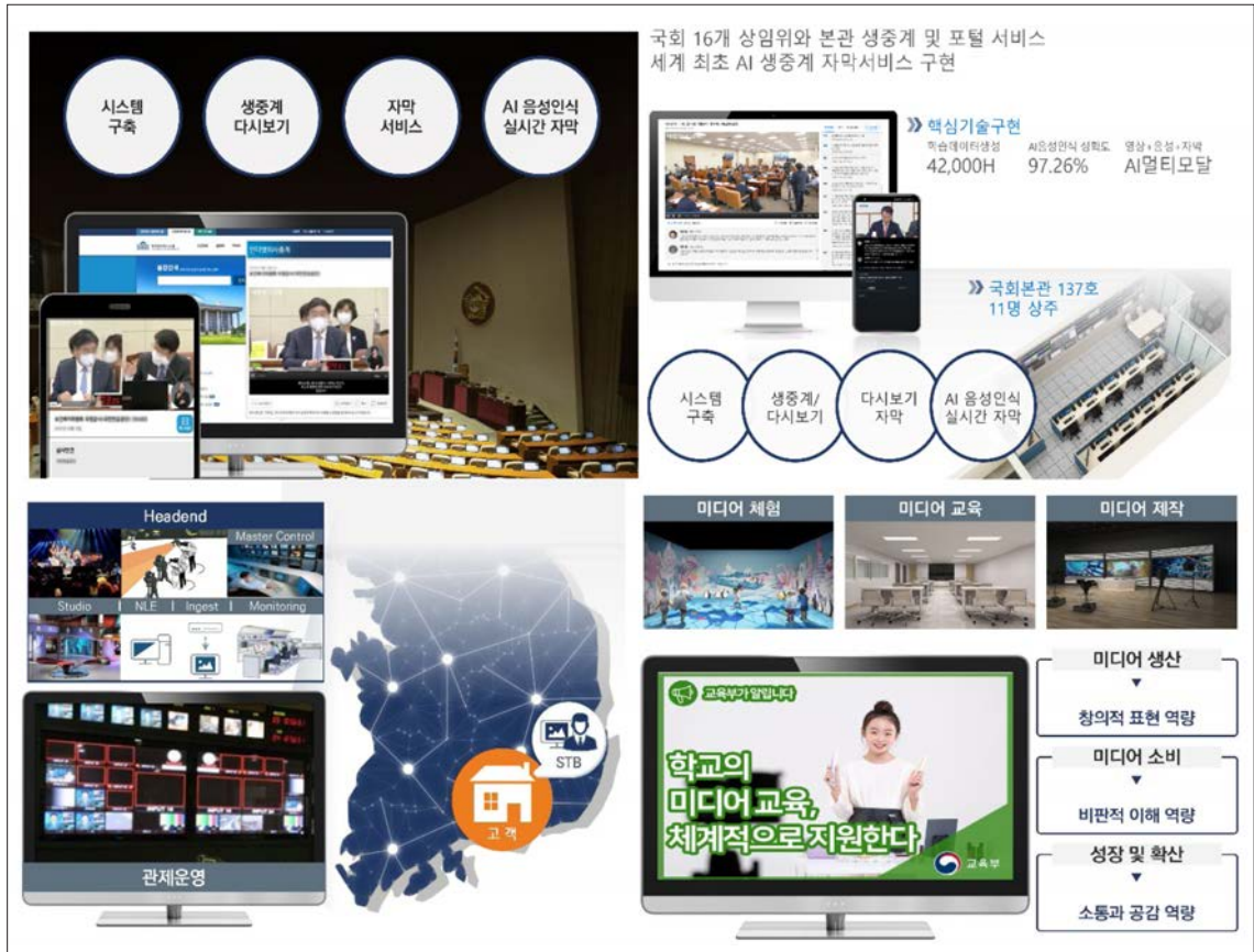
<그림 5> ICT 미디어 사업본부 추진 사업