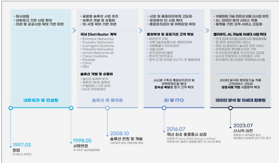
&lt;그림 1&gt; ㈜글로벌텔레콤 연혁