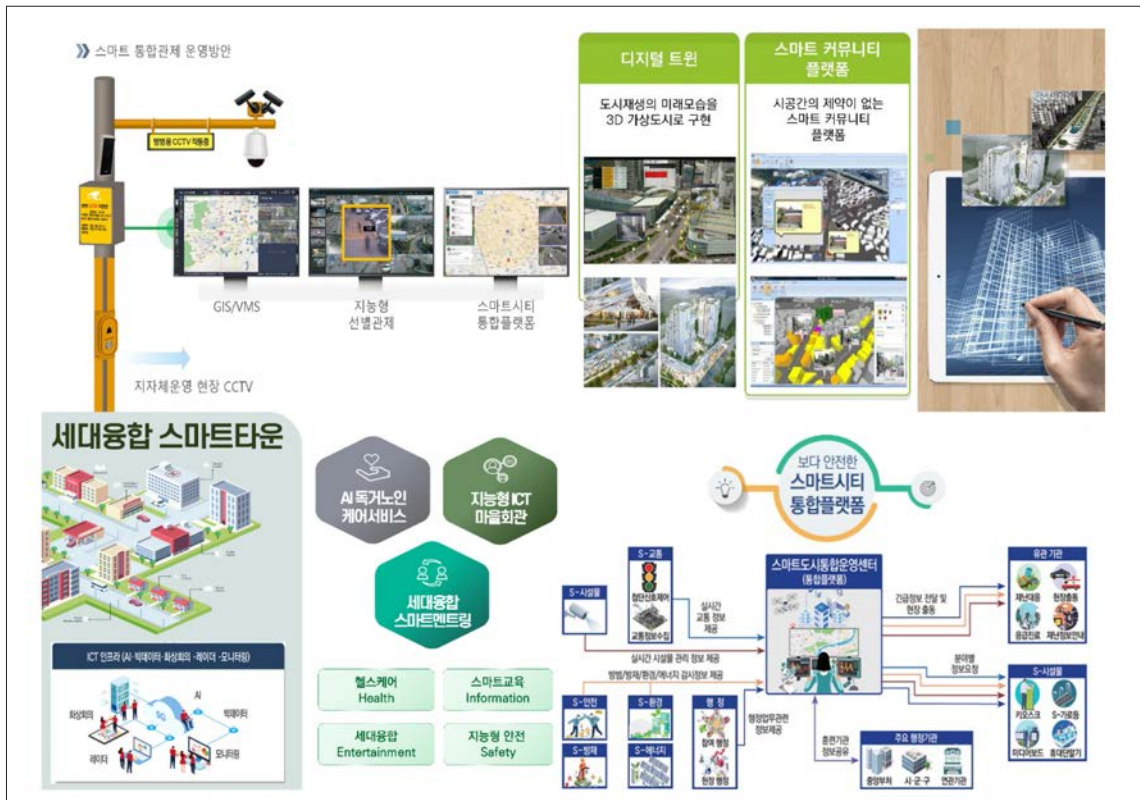
<그림 3> 영상플랫폼 사업본부 / 컨버전스 사업본부 추진 사업