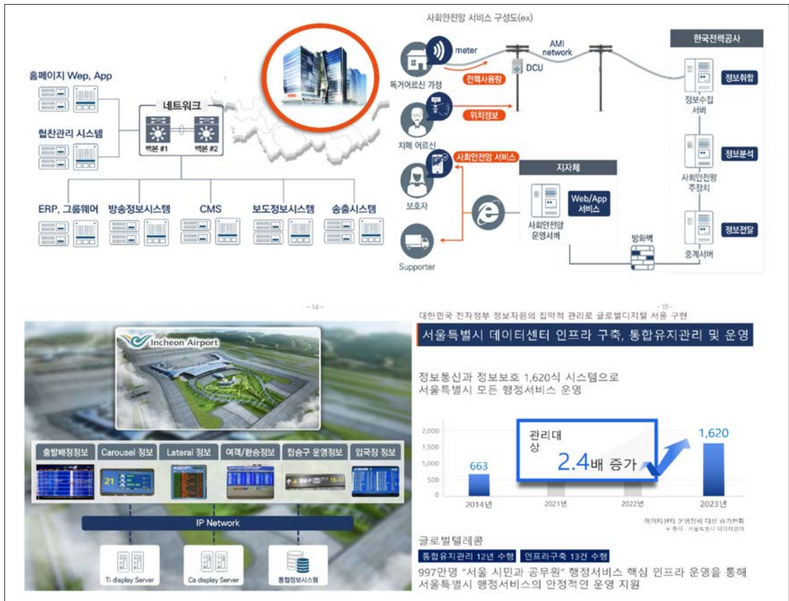
&lt;그림 6&gt; 공공사업본부 추진 사업