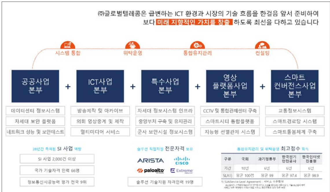
&lt;그림 2&gt; ㈜글로벌텔레콤 사업본부